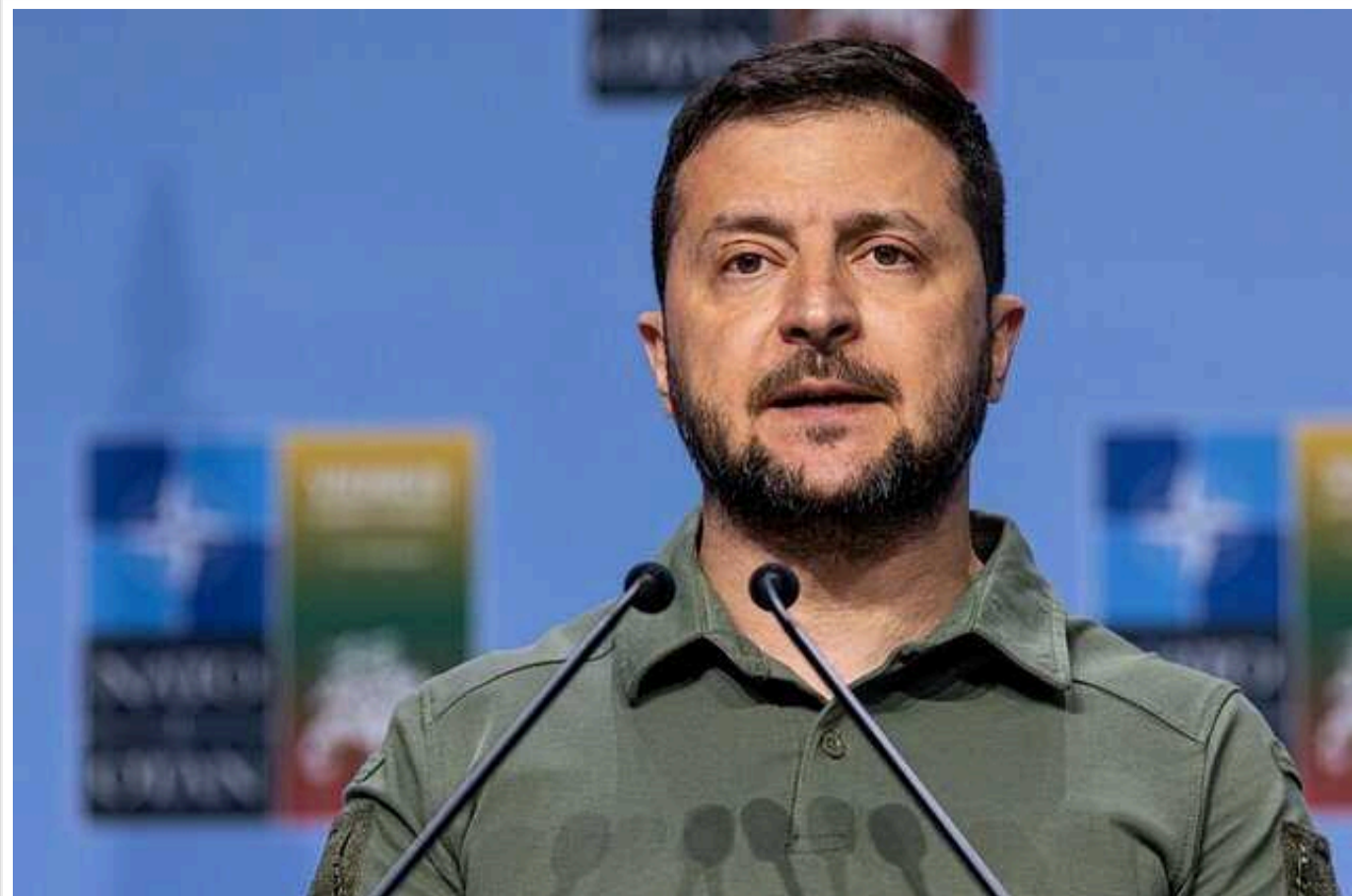
Зеленський припустив можливість війни РФ із НАТО

Війна Росії з НАТО можлива, під загрозою можуть бути балтійські країни. Протистояння можливе, якщо Україна не встоїть.