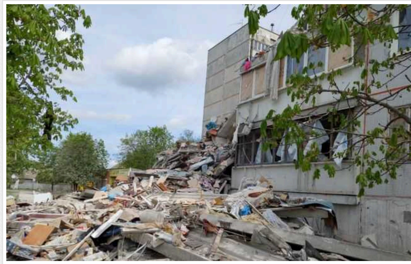
У Вовчанську збільшилася кількість жертв після обстрілу

Російські війська прицільно вдарили по багатопверхівці у Вовчанську Харківської області 20 квітня. Наразі двоє людей загинули.