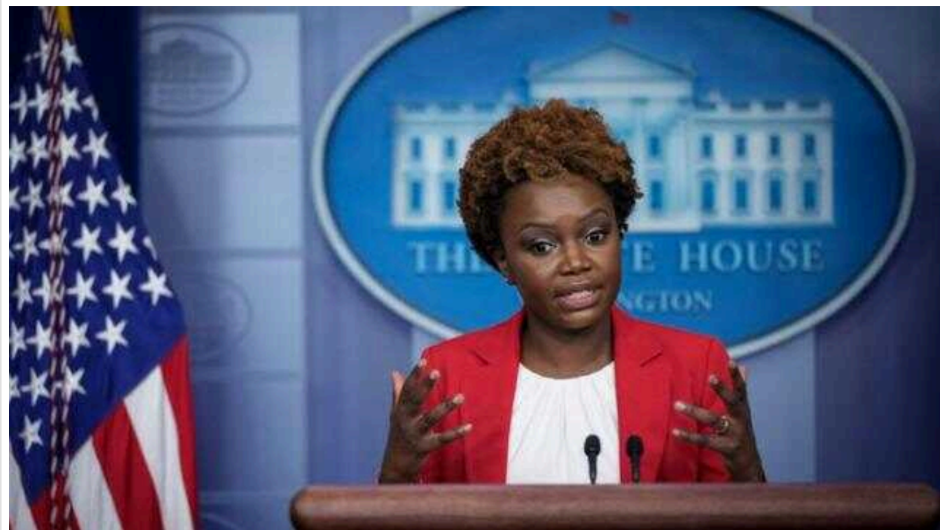
США продовжать консультації з Ізраїлем щодо операції в Рафаху, - Карін Жан-П'єр

У Білому домі заявили, що мають намір продовжувати дискусії з ізраїльською стороною щодо потенційної наземної операції у місті Рафах на півдні Гази.