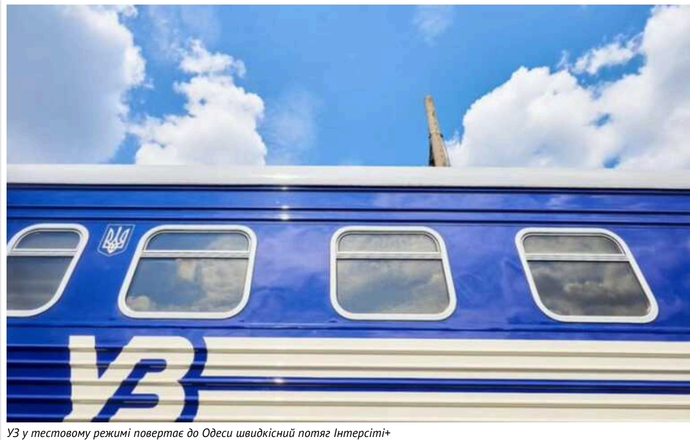
УЗ у тестовому режимі повертає до Одеси швидкісний потяг Інтерсіті+

Українізція заявила, що у тестовому режимі повертає до Одеси швидкісний потяг Інтерсіті+.