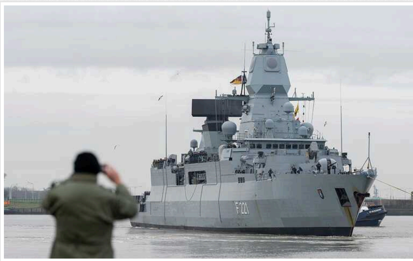
У Червоному морі німецький військовий корабель завершив свою місію

Німецький фрегат завершив свою місію із захисту торгових суден від бойовиків-хуситів у Червоному морі.