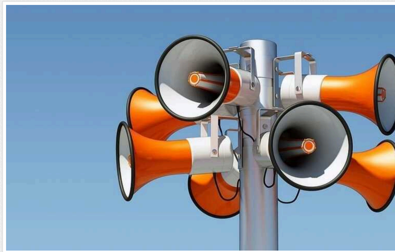
В Україні оголошено повітряну тривогу - через зліт МіГ-31К

Масштабна повітряна тривога в Україні була оголошена 20 квітня. Росія підняла у повітря літак МіГ-31К.