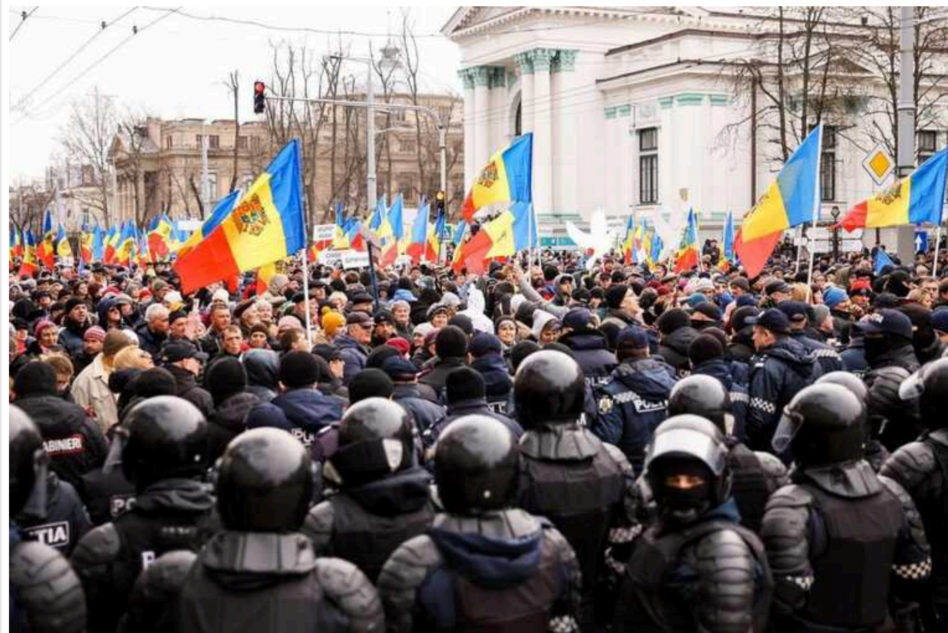
ISW: РФ намагається створити умови для виправдання можливої агресії в Молдові

У Молдові проросійські діячі продовжують створювати умови для виправдання можливої майбутньої агресії Росії.