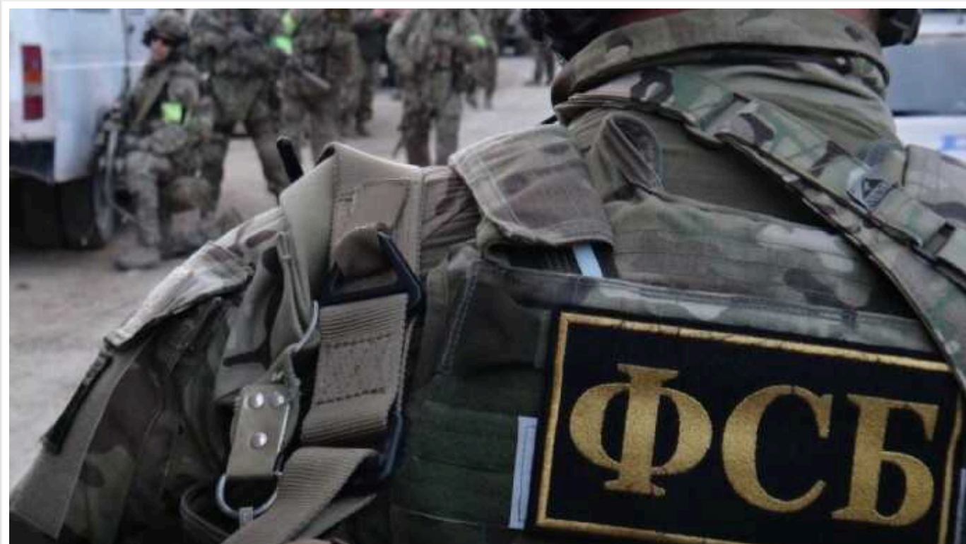
Загарбники перетворюють мешканців окупованих територій на «терористів»: «ФСБ готова вести зачистку до останнього українця»

На окупованих територіях України російські загарбники тероризують місцевих жителів, затримуючи їх з будь-якого приводу і кидаючи за ґрати. Головну роль тут грає ФСБ, яка давно перетворилася зі спецслужби на каральний орган кремлівського режиму. А в окупації у неї і зовсім карт-бланш.