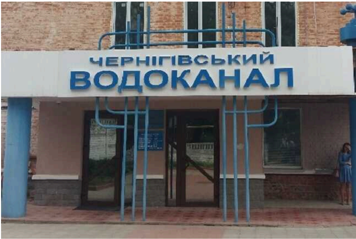
Чернігівводоканал звинуватили у «заточках» і семикратному завищенні ціни на тендері за 35 мільйонів

КП «Чернігівводоканал» 18 квітня провело розкриття пропозицій на тендері щодо закупівлі електролізної станції очікуваною вартістю 34,58 млн грн. Єдиним учасником виявилось ПП «Арсенал-Плюс», яке не скинуло ні копійки.