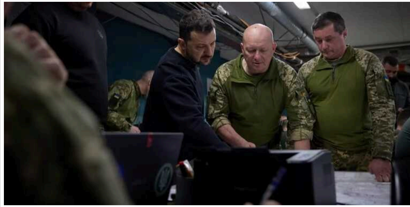
Під час візиту до Донецької області Зеленський відвідав один із командних пунктів 41-ї ОМБр, яка захищає Часів Яр

Президент України Володимир Зеленський відвідав командний пункт 41-ї ОМБр, яка обороняє Часів Яр.