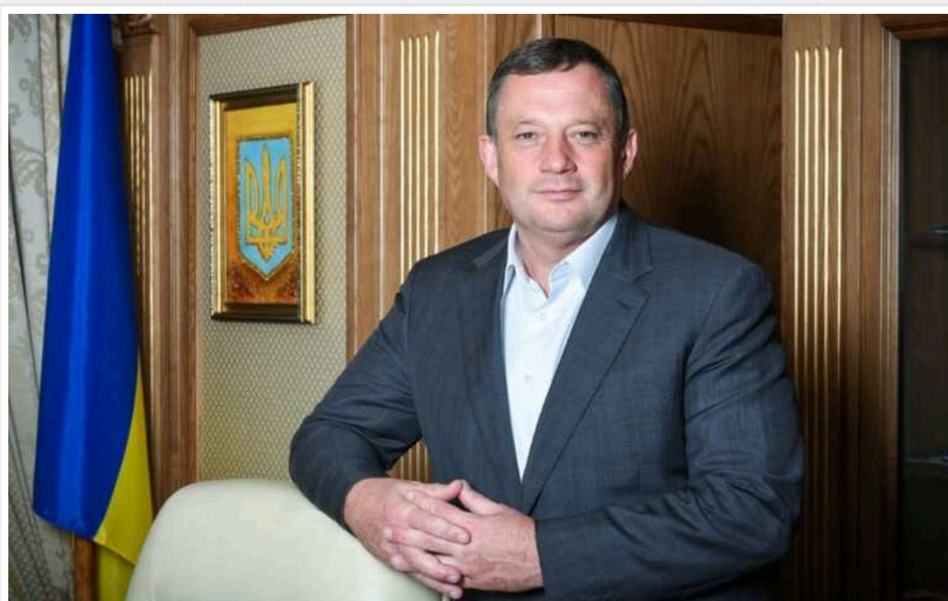
НАБУ буде розслідувати заочно справу нардепа Дубневича

ВАКС дозволило НАБУ та САП здійснювати спеціальне досудове розслідування щодо народного депутата Ярослава Дубневича.