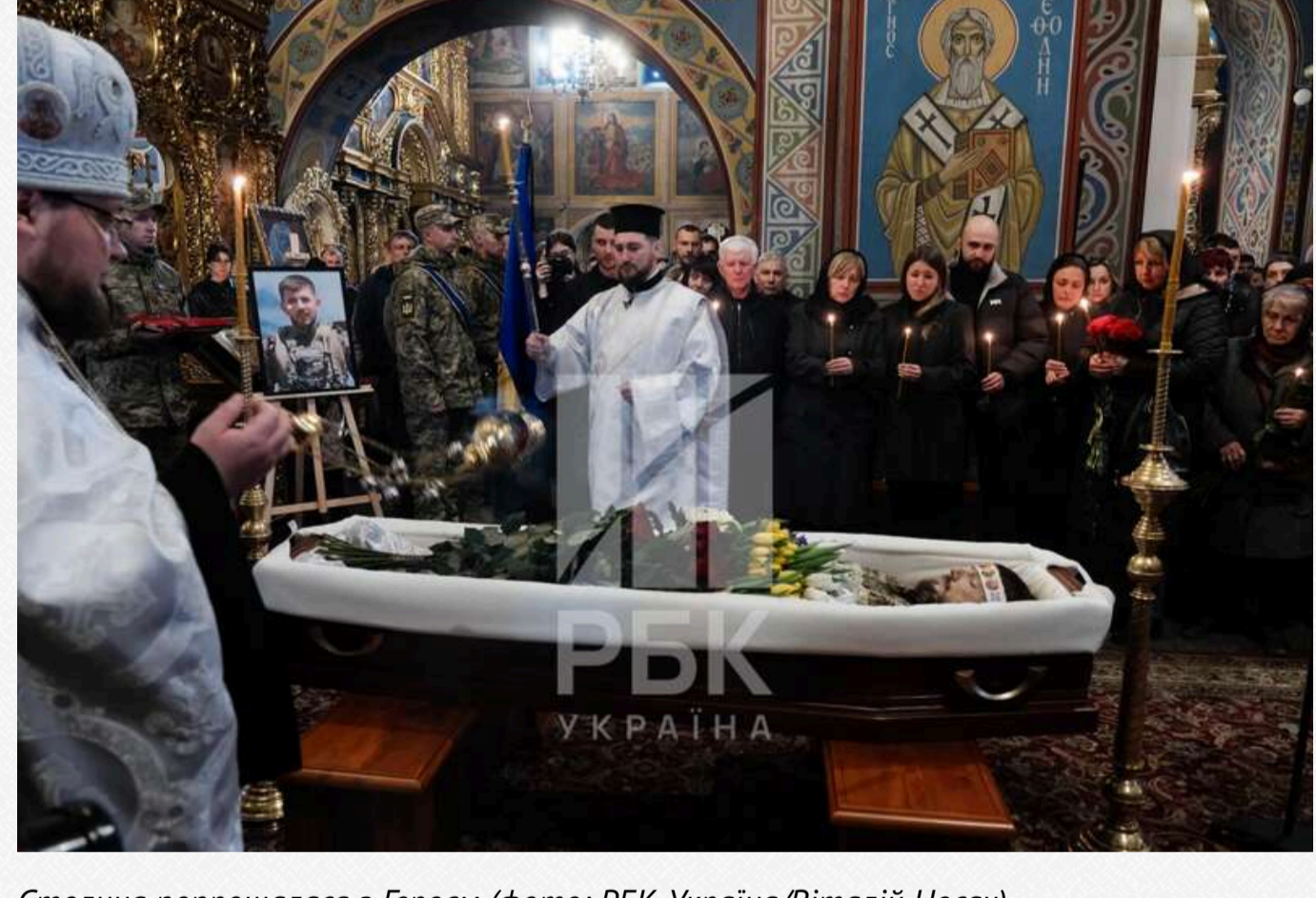
Столиця попрощалася з Героєм