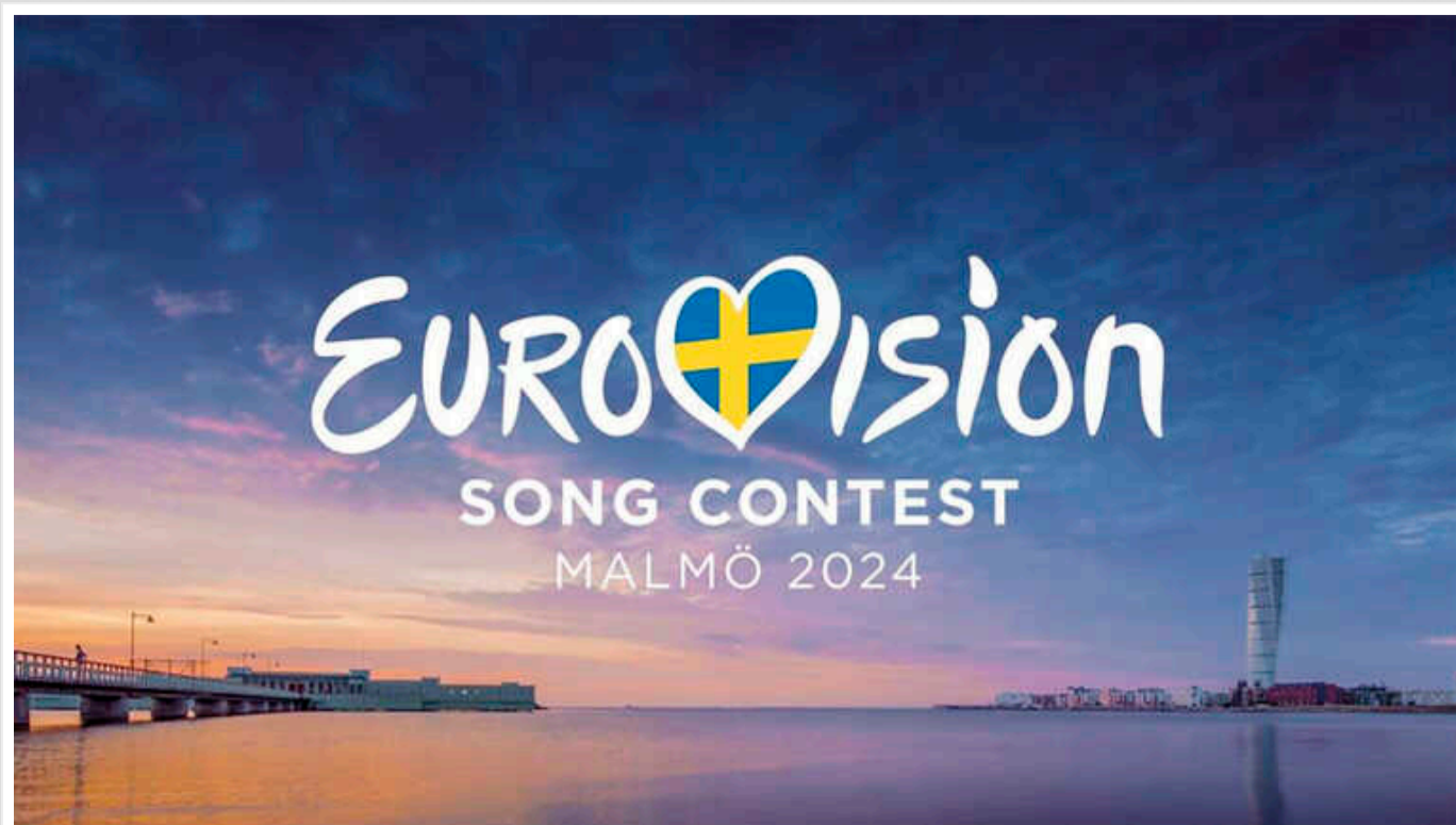
Букмекери назвали десятку переможців першого півфіналу Євробачення-2024

Перший півфінал Євробачення 2024 відбудеться 7 травня в місті Мальме, Швеція, і саме тоді на великій сцені виступатимуть українські учасниці аlyona аlyona і Jery Heil. Букмекери, які вже визначилися з ймовірними лідерами голосувань, прогнозують українкам вихід у фінал із майже 100% вірогідністю.