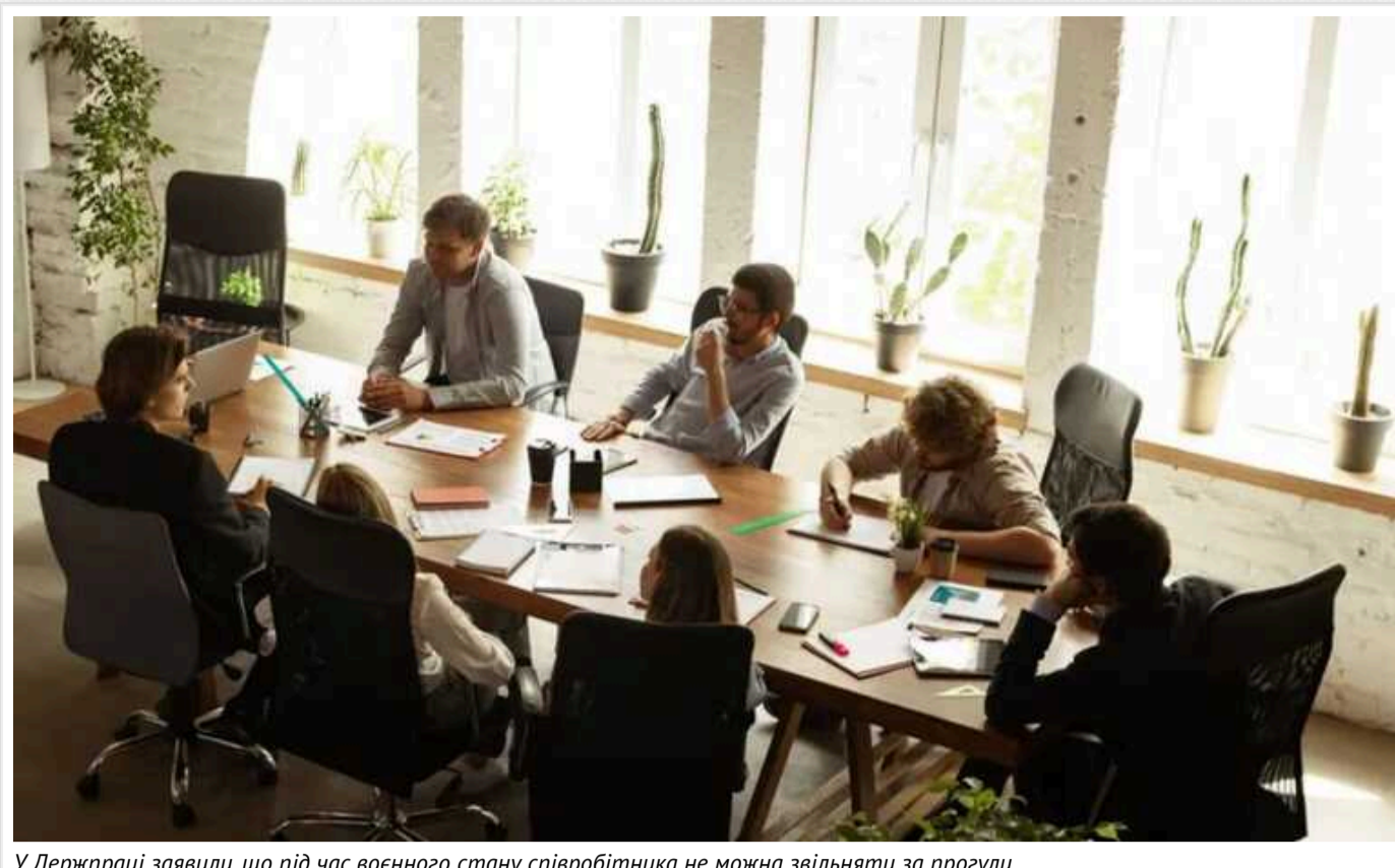
У Держпраці заявили, що під час воєнного стану співробітника не можна звільняти за прогули

Державна служба з питань праці заявила про те, що прогули тих співробітників, які переїхали в інший регіон або виїхали за кордон під час воєнного стану, не можуть бути причиною звільнення. Замість звільнення їх можна відправити в неоплачувану відпустку або оформити дистанційну роботу.