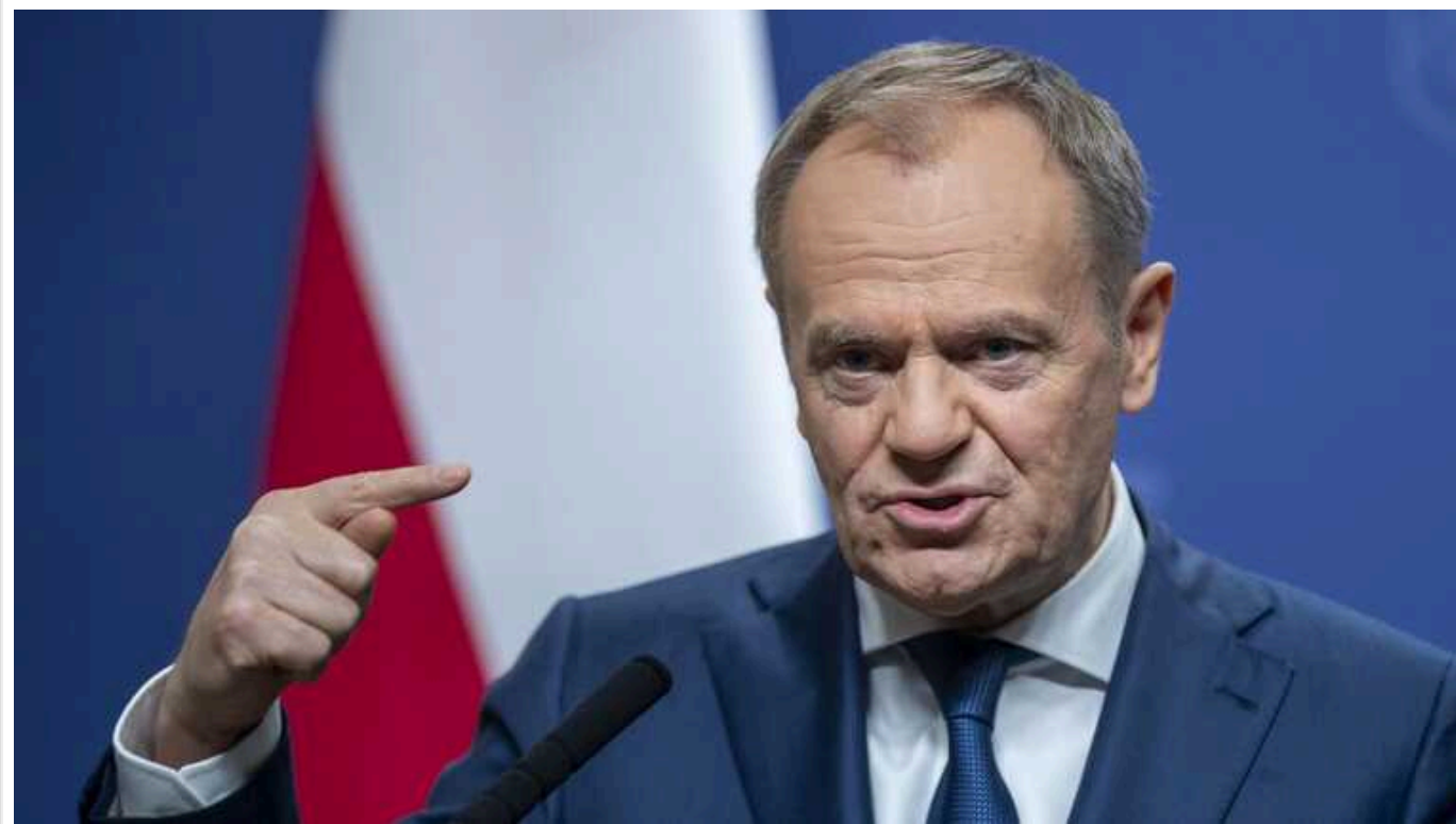
Польща не має можливості надати Україні ППО Patriot

Прем'єр-міністр Польщі Дональд Туск заявив, що Варшава не має змоги поставити українській стороні системи протиповітряної оборони Patriot.