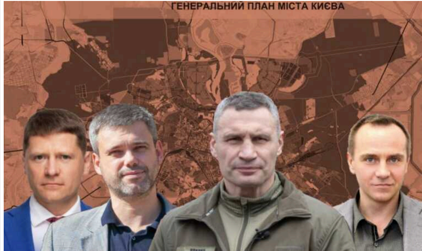
У Київраді вирішили забути про "Генплан Черновецького" та змінити під себе "старий" Генплан

Київрада скасувала своє скандальне рішення від 18 вересня 2008 року № 262/262 "Про розробку нового Генплану розвитку Києва та його приміської зони до 2025 року" (так званий Генплан Черновецького) і дала відомашку розробці містобудівної документації "Внесення змін до Генерального плану міста Києва" (чинний, затверджений у 2002 році документ, який у КМДА і міськраді довіг роки безжорно ігнорували).