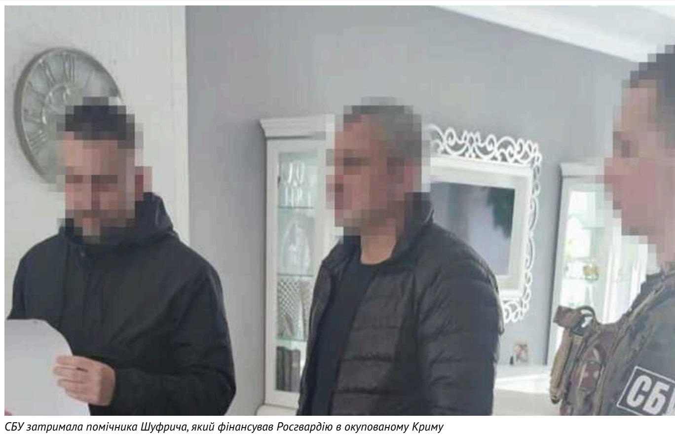
СБУ затримала помічника Шуфрича, який фінансував Росгвардію в окупованому Криму

За даними слідства, він закривав усі юридичні питання під час укладання договору зі структурами Росгвардії на охорону елітної вілли Шуфрича у Криму.