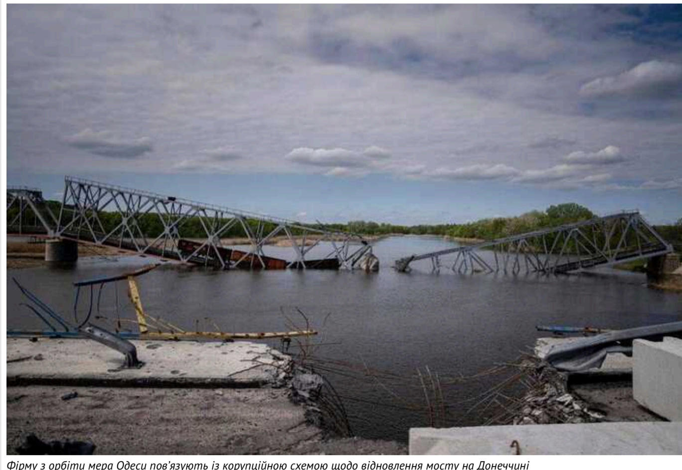
Фірму з орбіти мера Одеси пов'язують із корупційною схемою щодо відновлення мосту на Донеччині

Фірму «Автомагістраль-Південь», яка пов'язана з очільником Одеси Геннадієм Трухановим, підозрюють у корупційній схемі щодо відновлення мосту через річку Сіверський Донець в Донецькій області.