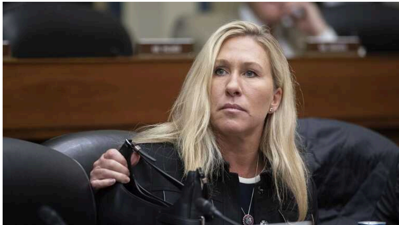
Прихильниця Трампа внесла поправку до законопроекту Джонсона: члени Конгресу будуть зобов'язані вступити до лав ЗСУ

Членкиня Палати представників Марджорі Тейлор Грін (республіканка, прихильниця Трампа) внесла поправку до законопроекту спікера Джонсона, згідно з якою, будь-який член Конгресу, який проголосує за допомогу Україні, зобов'язаний вступити до лав ЗСУ.