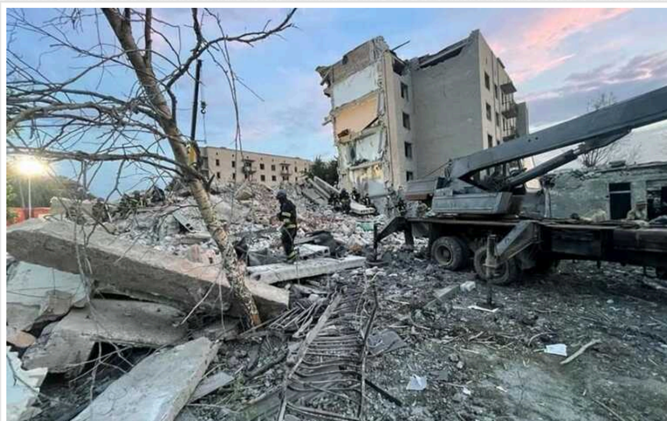
Часів Яр під повним контролем ЗСУ, але ворог намагається знищити місто КАБами

Окупанти не рахуються з втратами власного особового складу і військової техніки з метою захоплення міста.