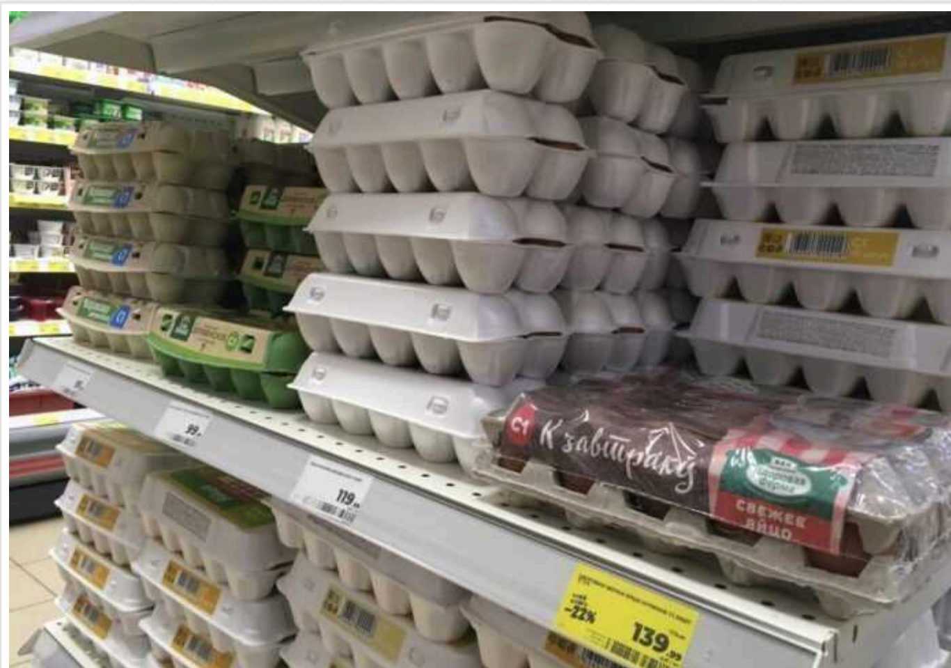
Перед "інавгурацією" Путіна в Росії взялися за яйця: влада вимагає тримати ціни

За кілька тижнів до чергової "інавгурації" Володимира Путіна (запланована на 7 травня) Федеральна антимонопольна служба (ФАС) Росії перейнялася цінами на яйця в країні. Так, вона направила виробникам та торговельним мережам попередження про неприпустимість необґрунтованого підвищення цін на цю продукцію у період сезонного підвищення попиту.