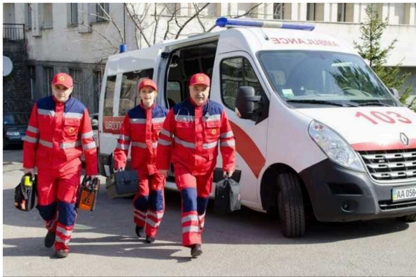
Окупанти вдарили по Дніпропетровщині: є постраждалі

Окупаційні війська Росії вдень 18 квітня обстріляли Дніпропетровську область. Під ракетний удар потрапив Дніпровський район, поранення отримали двоє чоловіків.