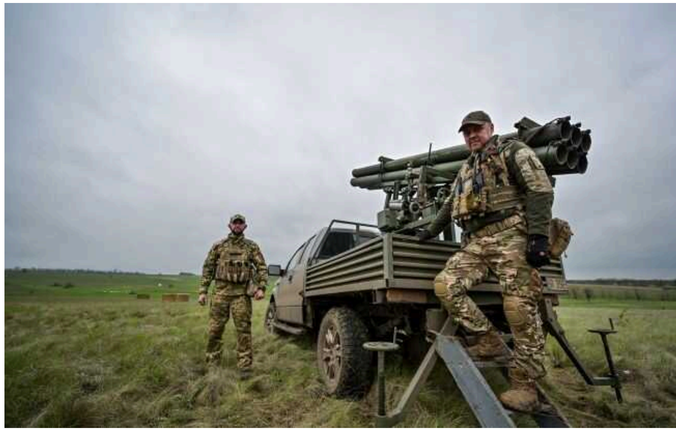
Аналіз ISW: Війська РФ проводять наступальні операції в районі Авдіївки, на лівобережжі Херсонщини тривають позиційні бої

Російські окупанти продовжують наступати на Авдіїському напрямку. Протягом доби 17 квітня ворог просунувся вздовж залізничної лінії на південний схід від населеного пункту Очеретине.