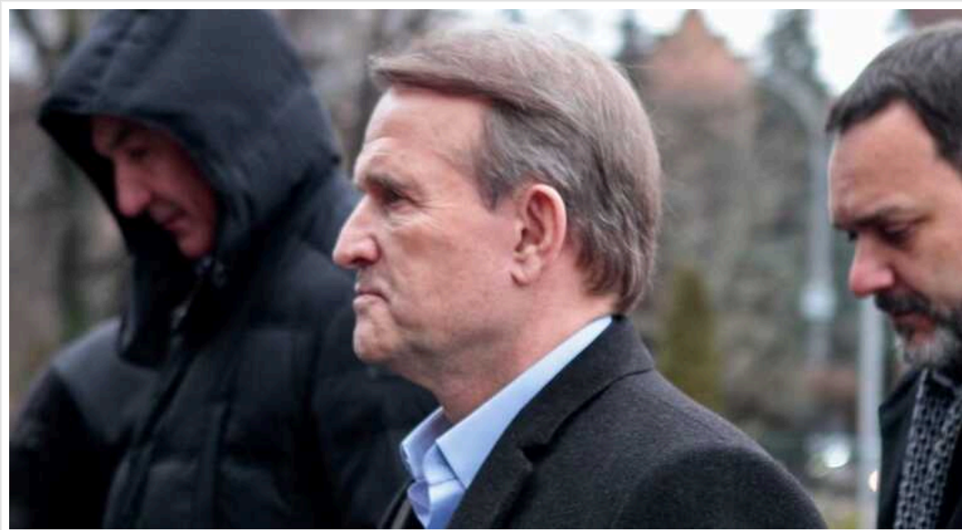
АРМА готує до продажу понад 260 картин із колекції Медведчука

Національне агентство з розшуку та менеджменту активів (АРМА) готувить до реалізації 264 картини, що належали Віктору Медведчуку.