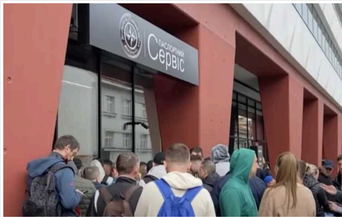
Мобілізація в Україні: чи загрожує чоловікам оновлення даних для ТЦК за кордоном екстрадицією

Член оборонного комітету Ради Федір Веніславський підтвердив, що тих, хто виїхав нелегально, теоретично можуть повернути в Україну. Однак, за його словами, ця процедура "дуже тривала".