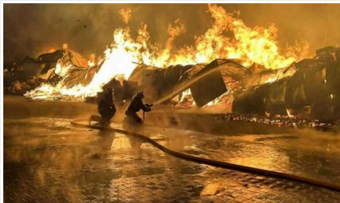
У Джанкої на аеродромі внаслідок ракетного удару загинули 30 російських військових, ще 80 поранено – ЗМІ

У ніч проти 17 квітня у тимчасово окупованому Джанкої пролунали потужні вибухи в районі військового аеродрому. Унаслідок "бавовни" могли загинути близько 30 російських окупантів, майже сотня ж отримала поранення.