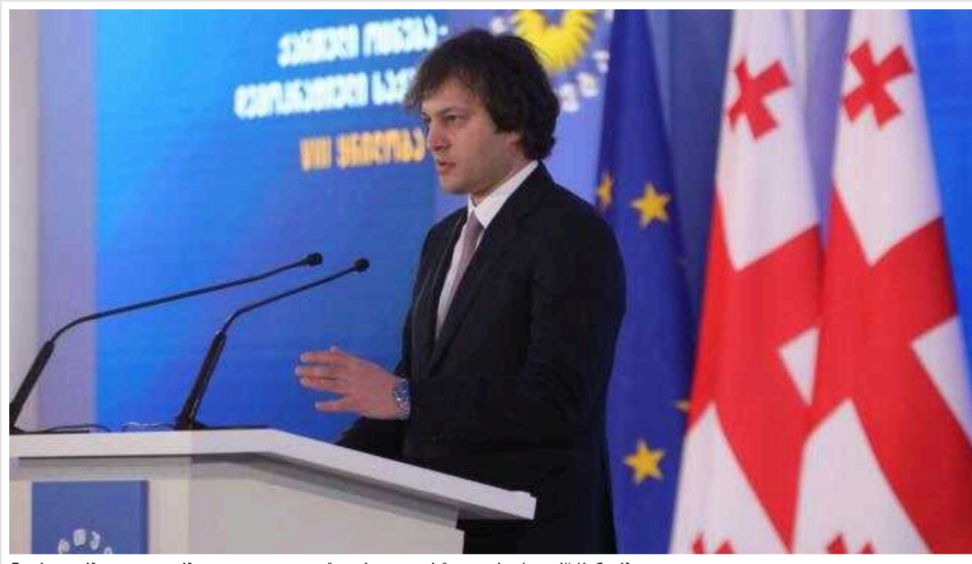
Грузія не відмовиться від ухвалення закону "про іноагентів", - прем'єр Іраклій Кобахідзе

Навіть незважаючи на критику з боку інших країн.