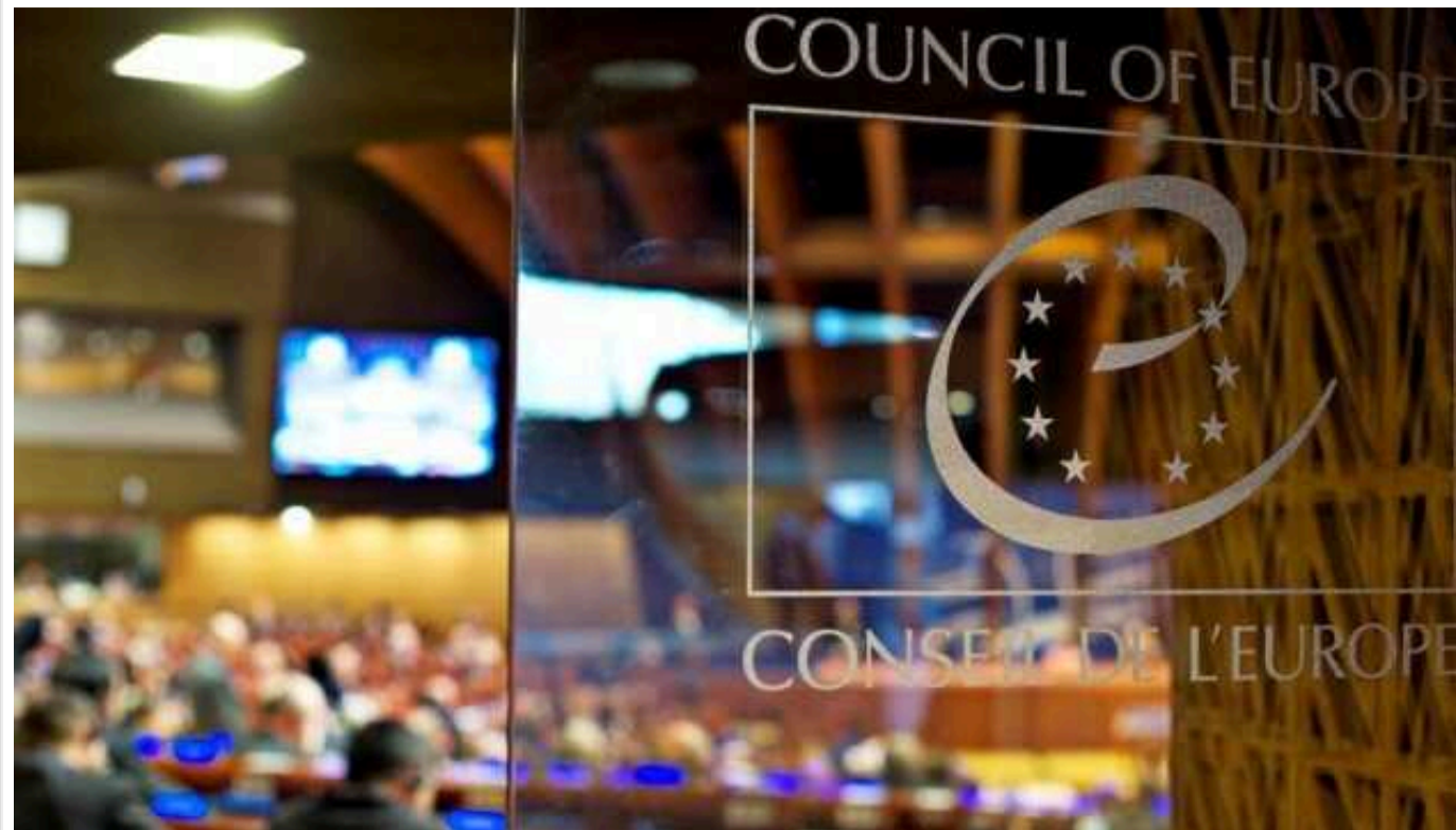
Комітет ПАРЕ схвалив поправки української делегації до резолюції щодо смерті опозиціонера Навального

Комітет із юридичних питань ПАРЕ підтримав запропоновані українською делегацією поправки до тексту резолюції щодо смерті Олексія Навального і засудження тоталітарного режиму в РФ стосовно визнання РПЦ інструментом розпалювання війни.