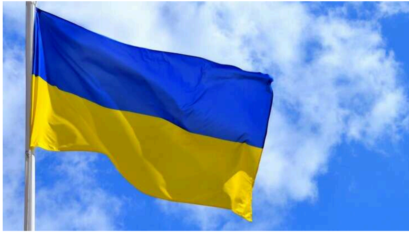
Україна планує відкрити п'ять нових посольств у Латинській Америці

Міністерство закордонних справ запропонувало на розгляд Президенту Володимирі Зеленському п'ять країн, де вважає за доцільне відкрити нові посольства.