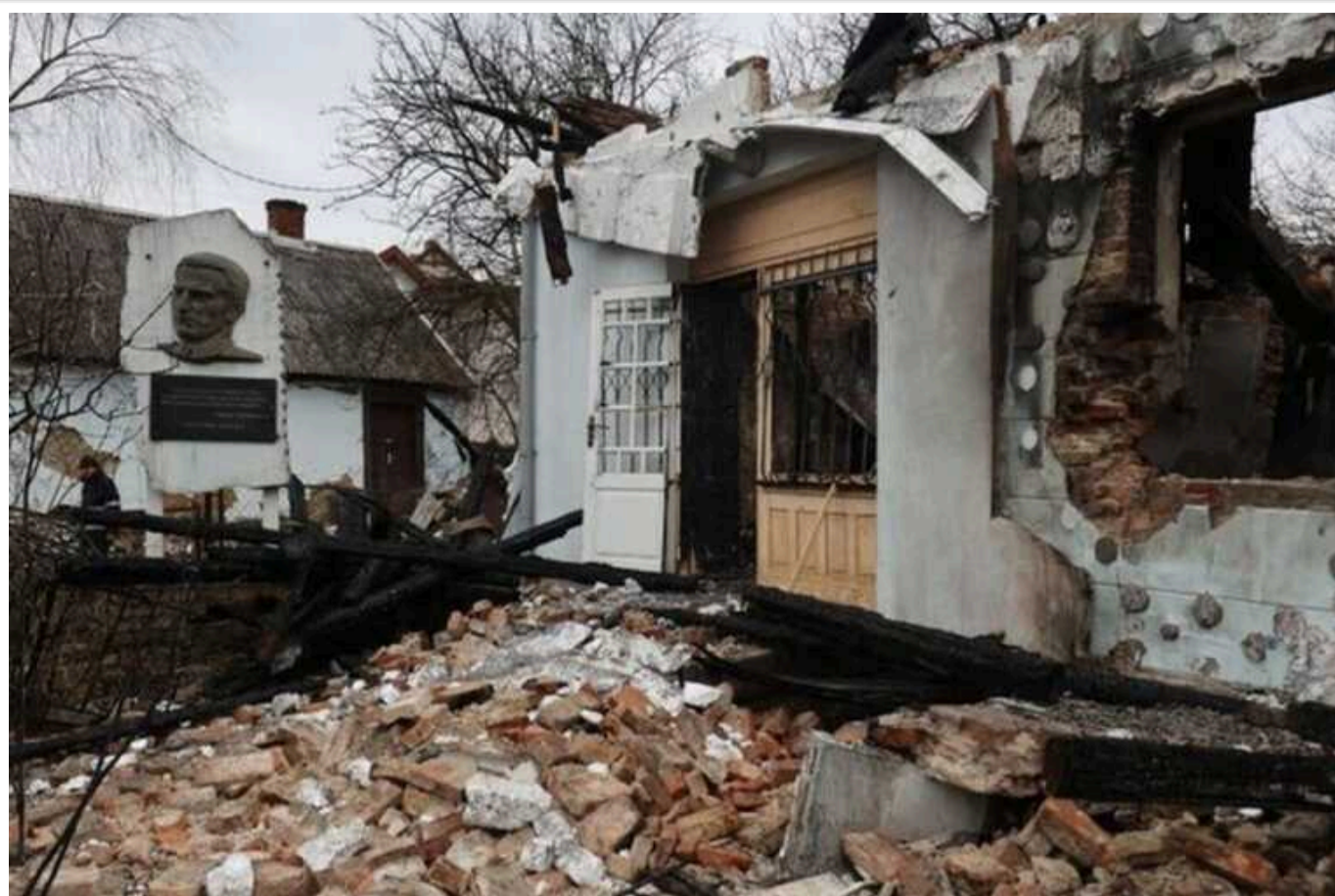
Фонд Петра Порошенка так і не дав грошей на відновлення музею Романа Шухевича

Політик публічно обіцяв надати гроші на відновлення зруйнованого дронами музею на Білогорщі.