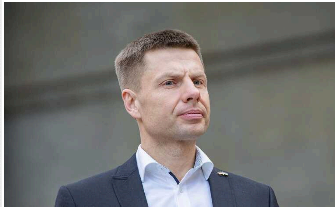
Нардеп пояснив, навіщо добиватися визнання Путіна нелігітимним президентом

Диктатора Володимира Путіна необхідно визнати нелігітимним президентом РФ. Це необхідно для того, аби країнам, які досі співпрацюють із Росією, ставало складніше це робити. Зокрема, йдеться про Угорщину, яка є членом Ради Європи, проте її прем'єр Віктор Орбан і зараз продовжує вести справи з Путіним.