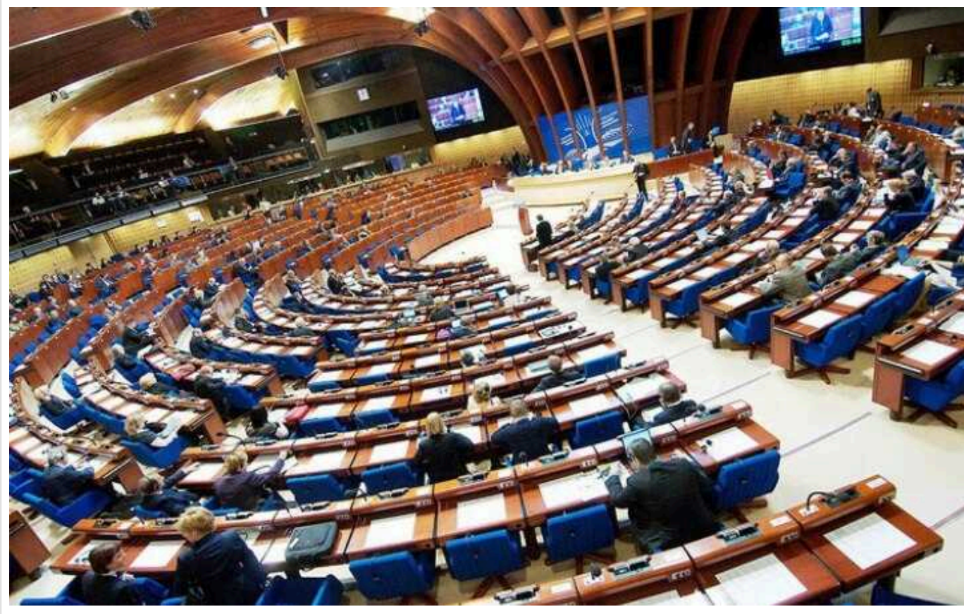
ПАРЄ одностайно ухвалила резолюцію щодо конфіскації російських активів

Парламентська асамблея Ради Європи (ПАРЄ) закликала передати заморожені активи центрального банку РФ на відновлення України. При цьому асамблея пропонує розширити дію конфіскації й на заарештовані в Європейському Союзі (ЄС) активи російських олігархів, які співпрацюють із Кремлем.