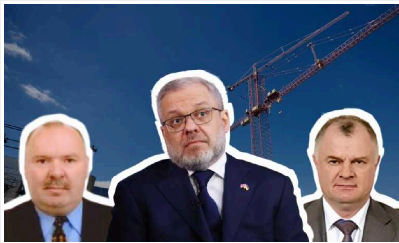
Керівники УБ ХАЕС Оцабрика і Балачук: диверсія чи корупція?

Проект будови енергоблоків Хмельницької АЕС стикнувся з несподіваною проблемою.