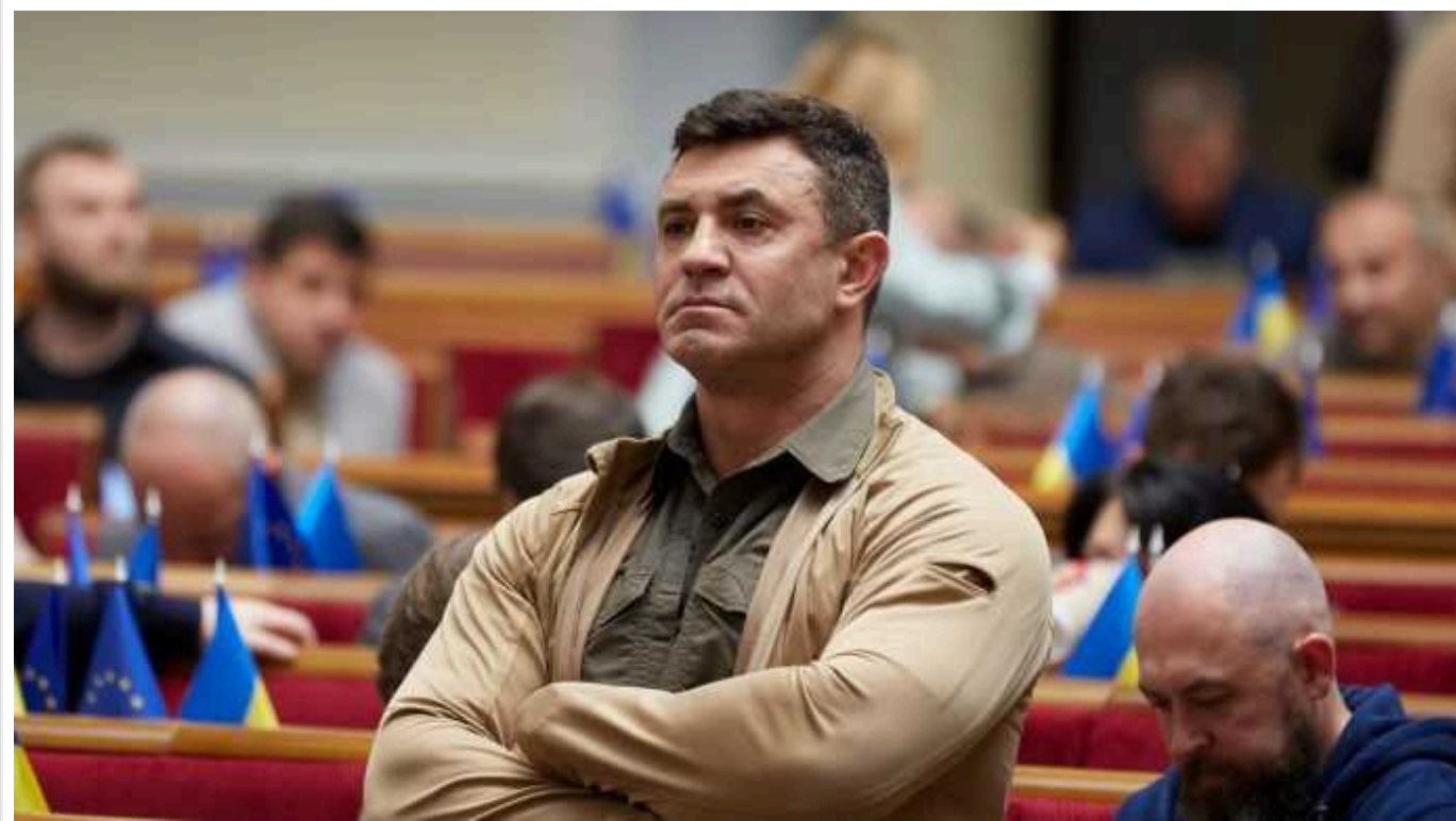
Микола Тищенко хоче взяти під корупційний контроль черги на кордоні та скасувати «ЄЧергу»

Українські транспортні компанії просять звернути увагу на активізацію Калі Тищенка щодо теми електронної черги для фур на кордоні.