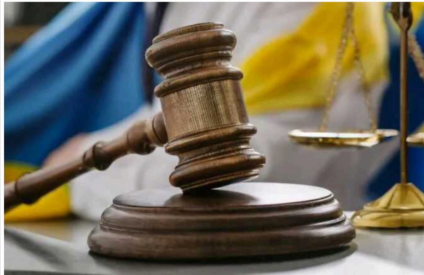
Мешканець Черкащини ухилився від мобілізації й отримав вирок суду

Військовозобов'язаний із Черкаської області отримав три роки позбавлення волі за ухилення від призову на військову службу під час мобілізації. Обвинувачений назвав "рабством" службу за контрактом, а ще говорив, що йому "немає за що воювати на Донеччині".