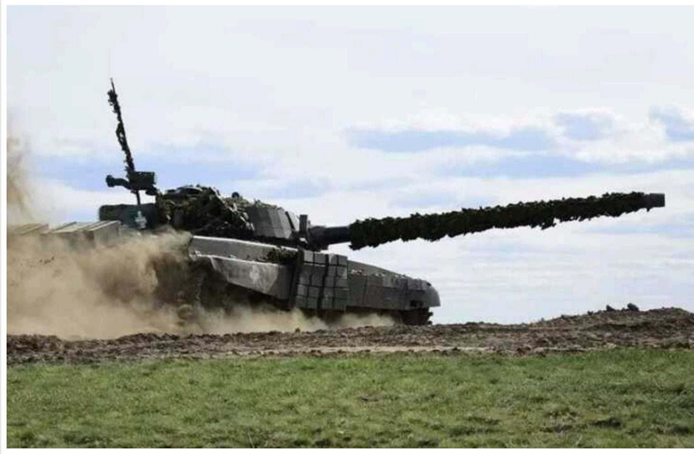
РФ намагається використати вразливість України на тлі затримки допомоги від Заходу

Російська терористична армія намагається скористатися затримками західної допомоги Україні, щоб покращити своє становище на фронті. Ворог зосереджує свої зусилля на сході країни у спробі прорвати оборону українських військ.