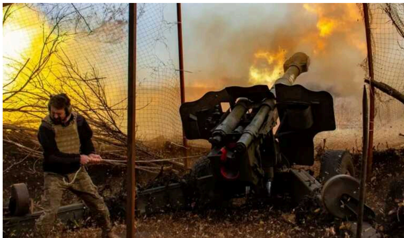
ЗСУ на півдні знищили дві станції РЕБ і спостережний комплекс «Муром-М» окупантів

Воїни Сил оборони України продовжують завдавати окупаційним російським військам великих втрат на передовій. У понеділок, 15 квітня, на південному напрямку на фронті ворог втратив ще дві станції радіоелектронної боротьби, а також цінний комплекс відеоспостереження "Муром-М".