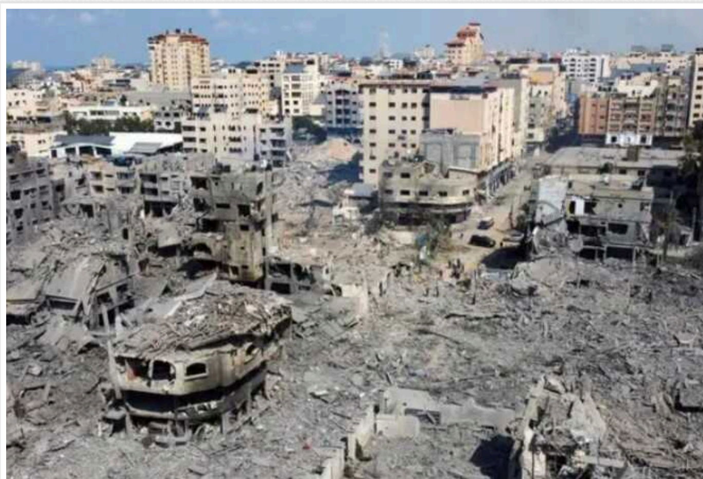
ВВС ЦАХАЛ завдали ударів по базах «Хезболли» у Лівані

Ізраїльська авіація атакувала військові бази терористів організації "Хезболла" на півдні Лівану. Удари були здійснені за допомогою винищувачів.