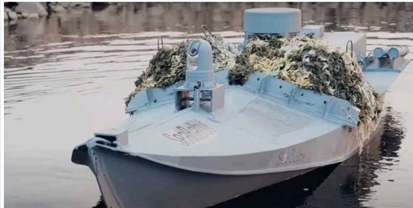
Морські дрони Sea Baby після модернізації можуть проходити понад 1000 кілометрів

Тепер вони можуть проходити понад тисячу кілометрів, доставляючи більше тонн вибухівки.