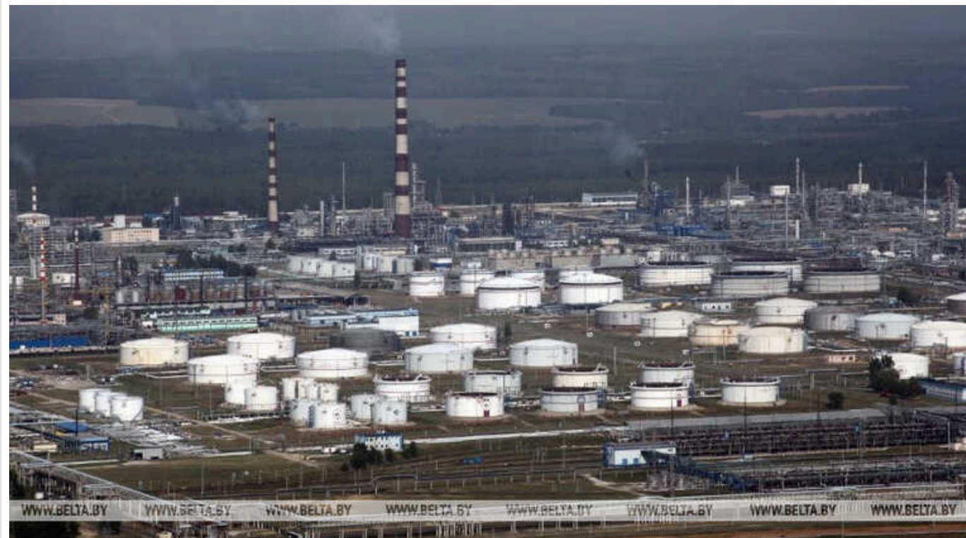
Чому так хвилюється Лукашенко і хто може вдарити по НПЗ Білорусі

Мінськ прекрасно розуміє, що може отримати удар по своїх НПЗ, якщо посилить обслуговування інтересів Путіна проти України. Удар можуть нанести білоруські добровольці, які бажають повалення режиму Лукашенка, кажуть експерти.