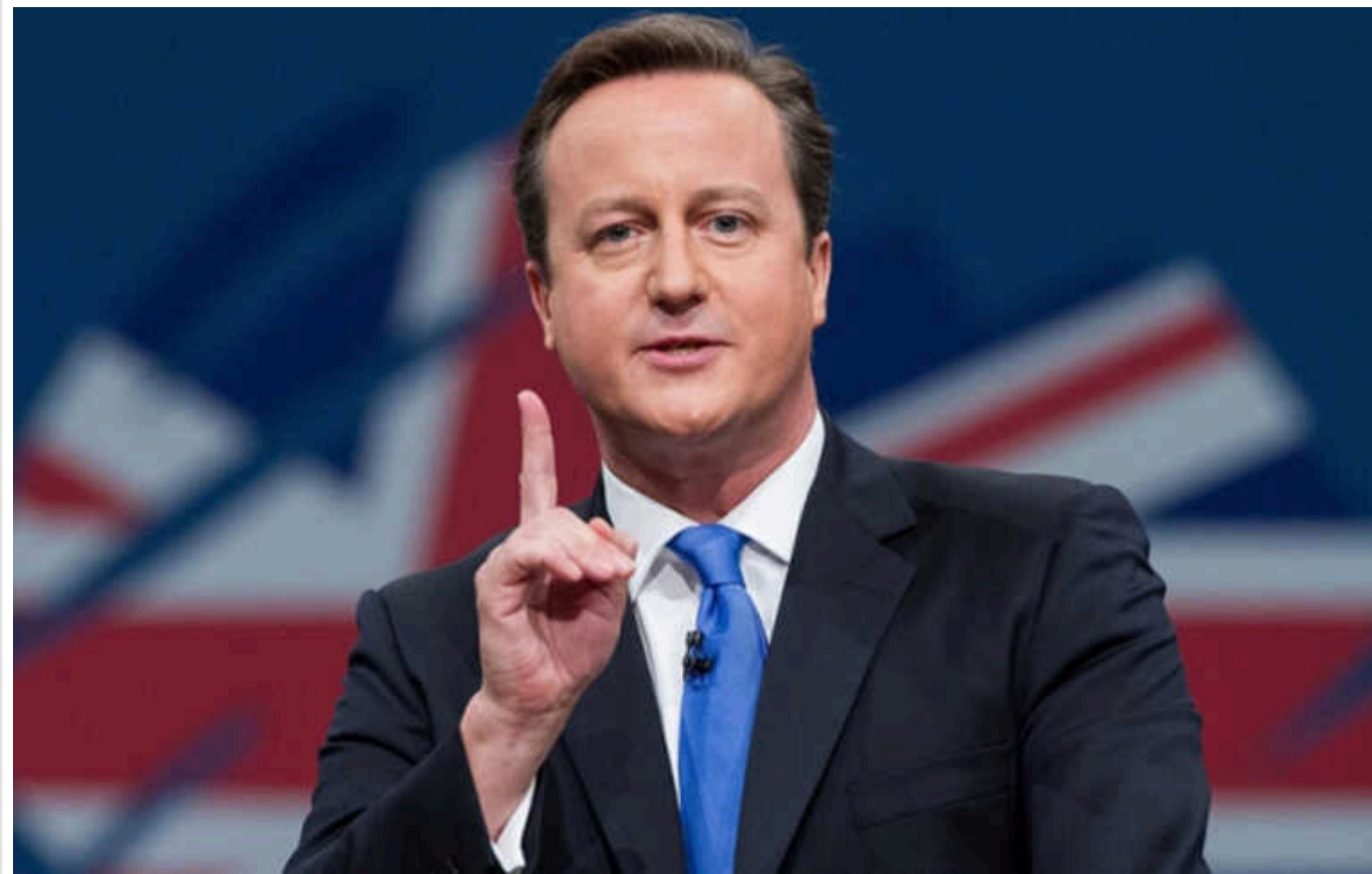
Чому ВПС Британії не можуть збивати БПЛА над Україною, як вони це роблять із Ізраїлем?

Таке запитання журналіст LBC поставив міністру закордонних справ Британії Девіду Кемерону.