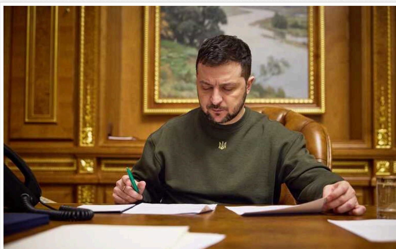
Зеленський змінив заступника секретаря РНБО

Раніше президент України Володимир Зеленський наголосив на основних факторах, на яких базуватиметься оновлена робота РНБО, в якій очевидними пріоритетами мають бути оборона держави та захист українського суспільства.