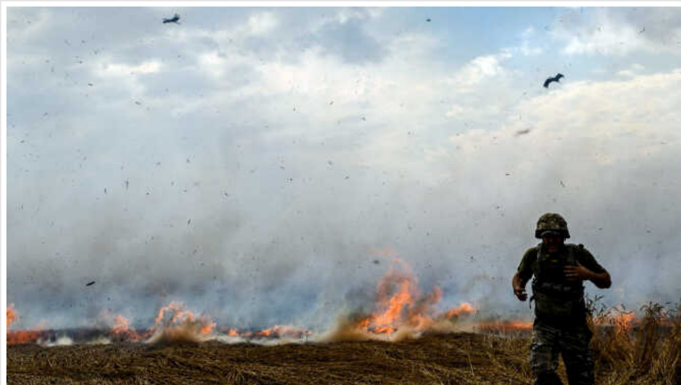
Ситуація на фронті: протягом доби зафіксовано 87 бойових зіткнень

В Україні протягом доби зафіксовано 87 бойових зіткнень. Руїнувань та пошкоджень зазнали багатопверхові та приватні будинки, а також інші об'єкти інфраструктури