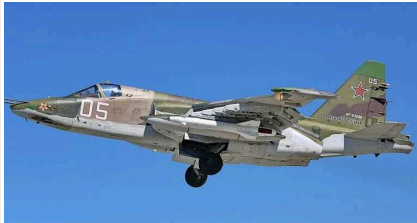
"Для цього є кілька інструментів": Україна повинна збивати літаки в РФ, — ISW

За словами Джорджа Барроса, Сполучені Штати не дозволили Україні атакувати літаки ЗС РФ у повітряному просторі Росії. Це необхідно зробити, оскільки перехопити вже запущені авіабомби дуже важко.