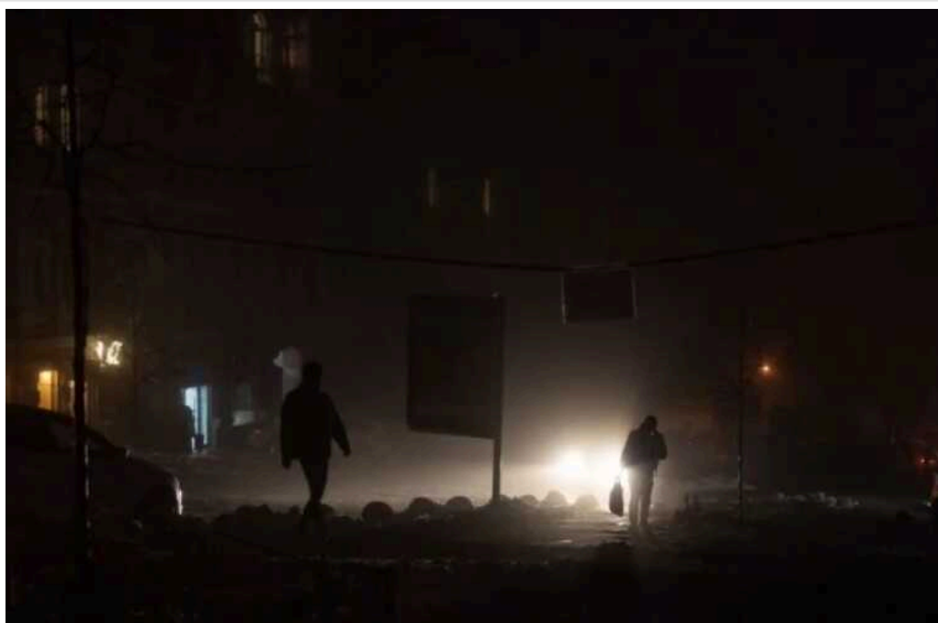
Росія змінила тактику обстрілів міст, - CNN

Майже усі зусилля з відбудови та ремонту протягом року були знищені за кілька днів, стверджує заступниця міністра енергетики.