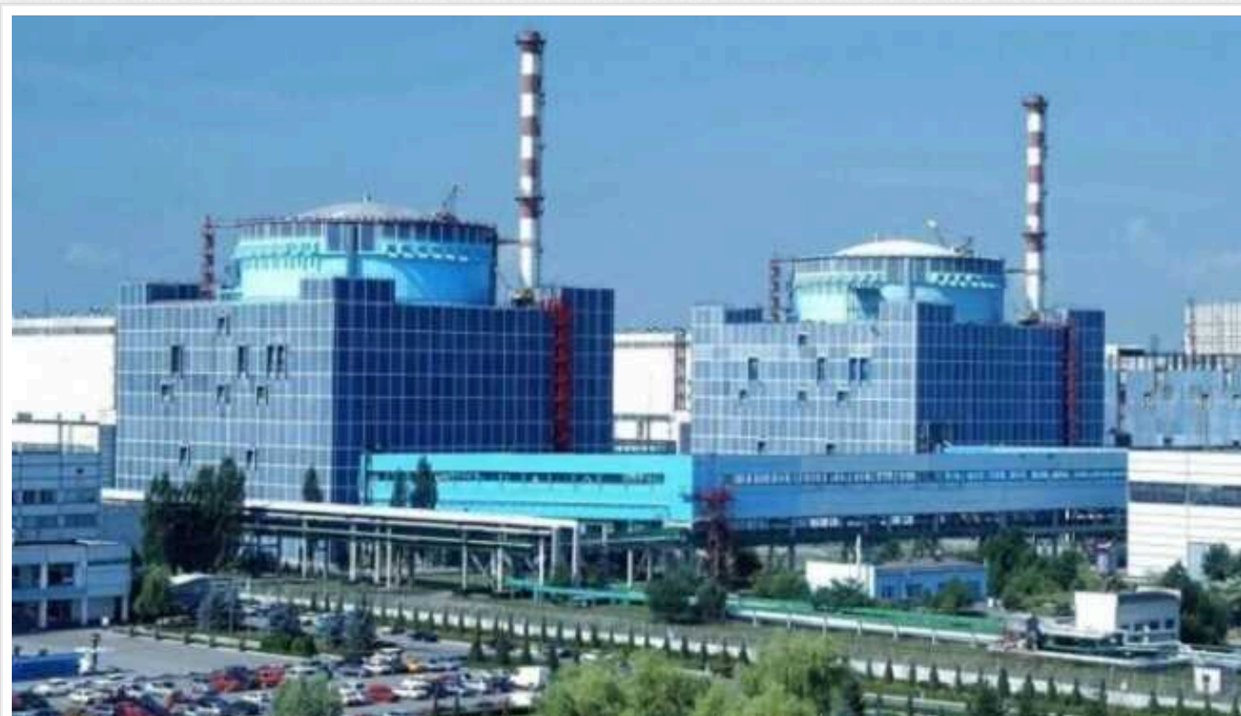
На Хмельницькій АЕС розпочалося будівництво енергоблоків №5, 6 за технологією Westinghouse

Енергоатом повідомляє, що на Хмельницькій АЕС розпочалося будівництво п'ятого та шостого енергоблоків за американською технологією AP1000 Westinghouse.