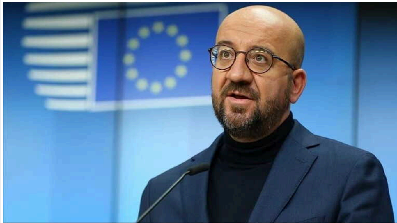
Країни G7 продовжать працювати над деескалацією конфлікту Ізраїлю та Ірану, - Мішель

Країни G7 докладатимуть зусиль, щоб не допустити ескалації конфлікту на Близькому Сході.