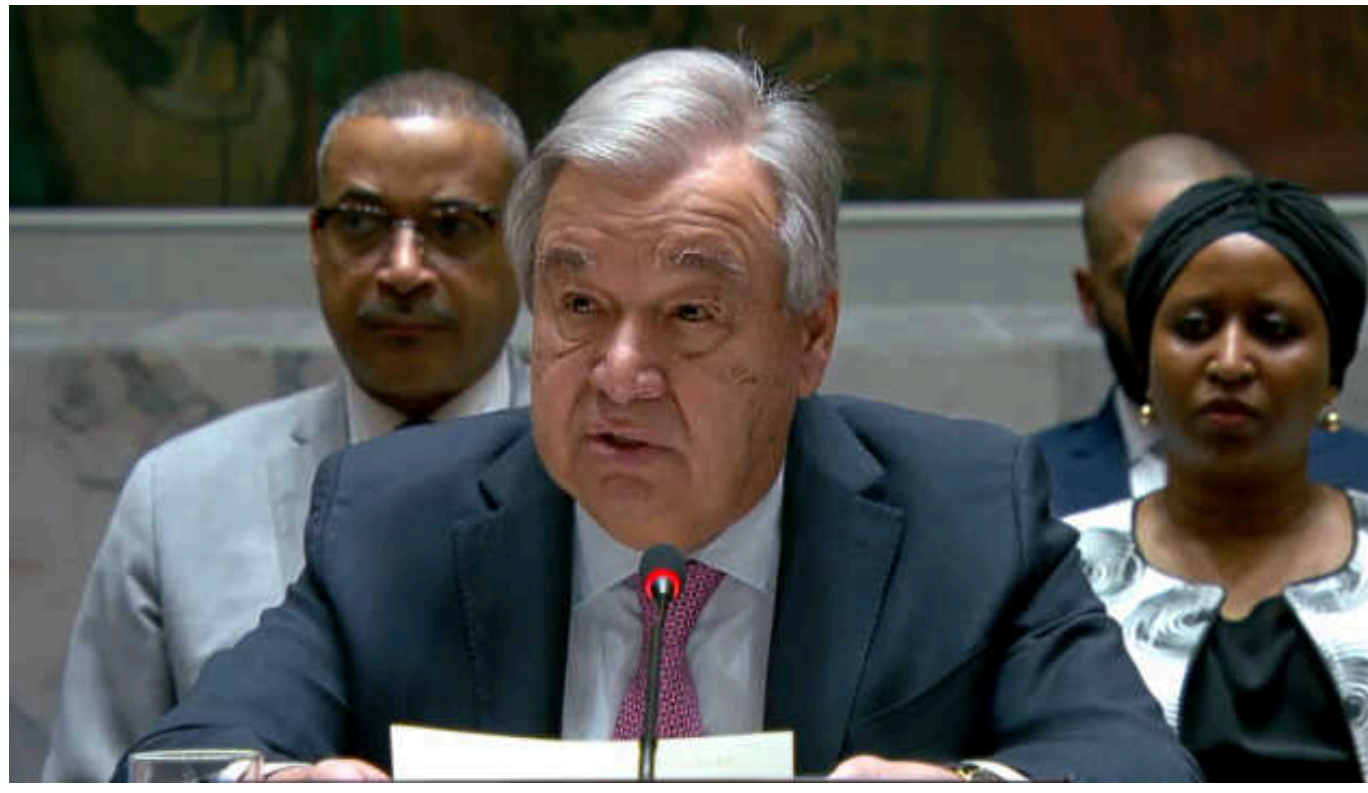
Генсек ООН Гутерріш закликав до стриманості та деескалації на Близькому Сході після удару по Ізраїлю

Генеральний секретар ООН Антоніу Гутерріш закликав до розрядки та негайної деескалації на Близькому Сході після того, як Іран завдав масованого авіаційно-ракетного удару по Ізраїлю в суботу.