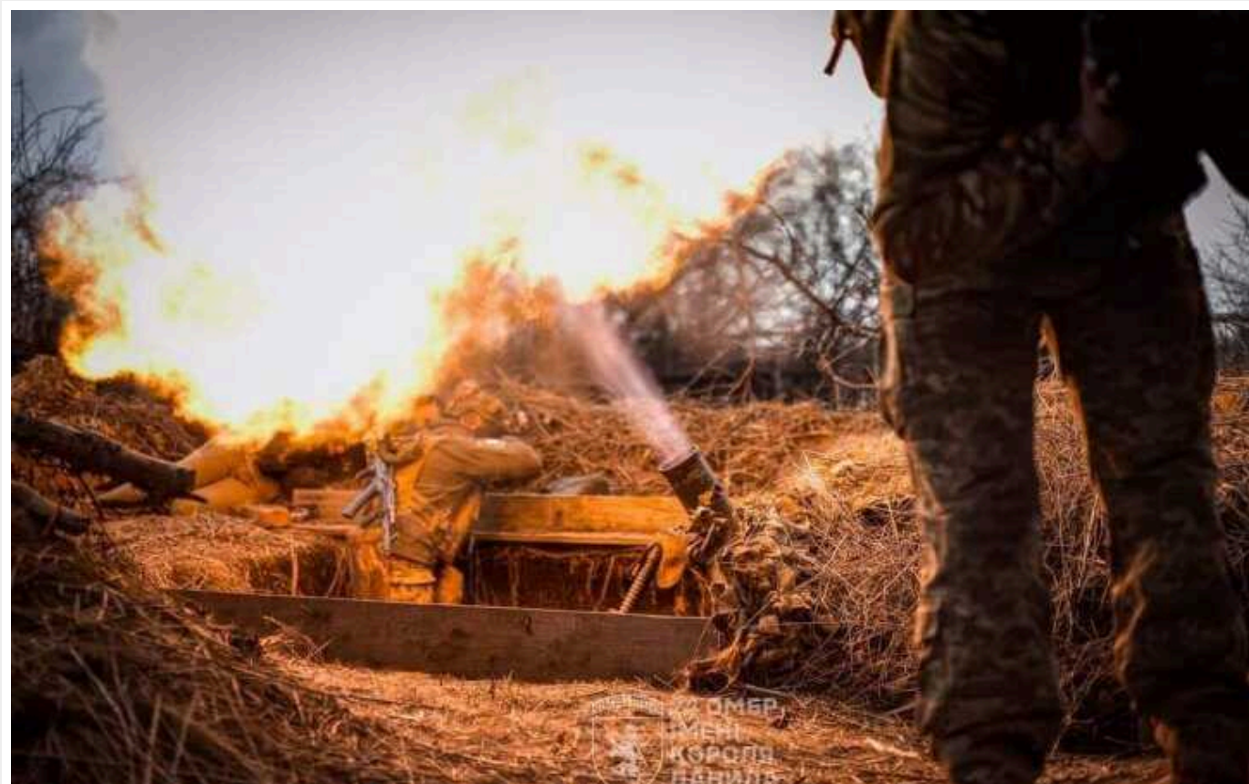
ЗСУ "перемололи" за тиждень тисячі окупантів

Командувач Сухопутних військ Збройних сил України генерал-лейтенант Олександр Павлюк назвав втрати російських окупантів за тиждень.