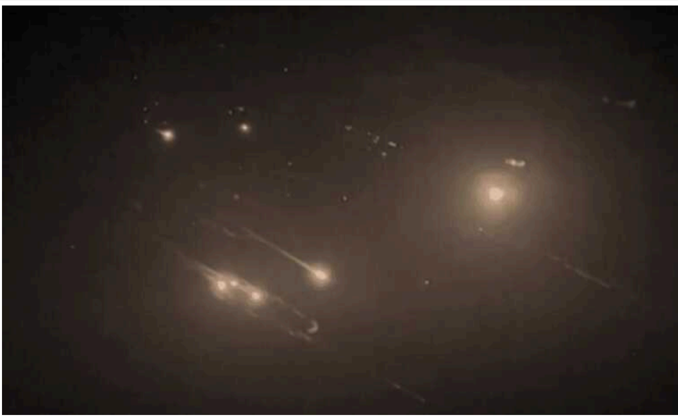
Іран хоче не допустити розростання конфлікту з Ізраїлем і залучення США, — ЗМІ